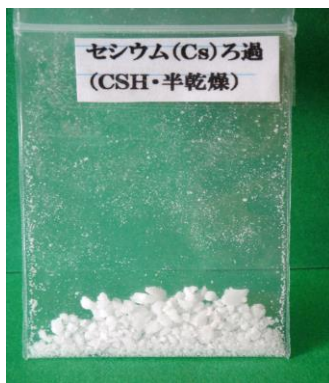
図1 Cs 濾過後乾燥